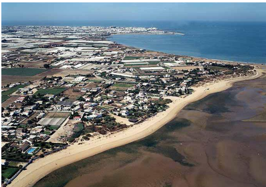
Fotografía 2: Vista de la zona en la que se ubicará la instalación